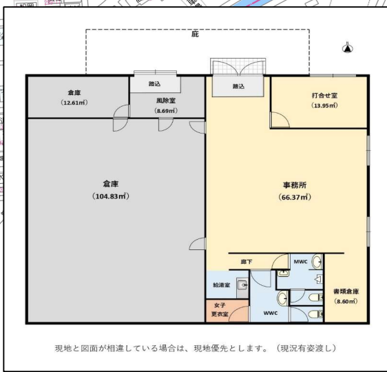
現地と図面が相違している場合は、現地優先とします。(現況有変差)